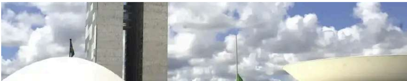
Vista dos prédios do Congresso Nacional, na Praça dos Três Poderes, em Brasília

3 abr 2026, 06h00 | Atualizado em 3 abr 2026, 10h13 | veja