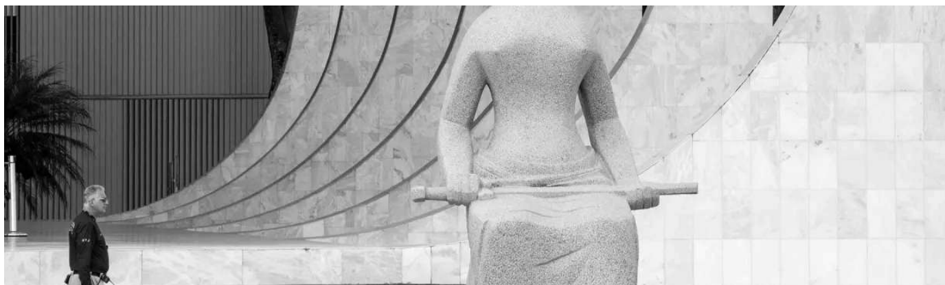
Fachada do STF