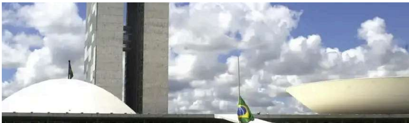
Vista dos prédios do Congresso Nacional, na Praça dos Três Poderes, em Brasília