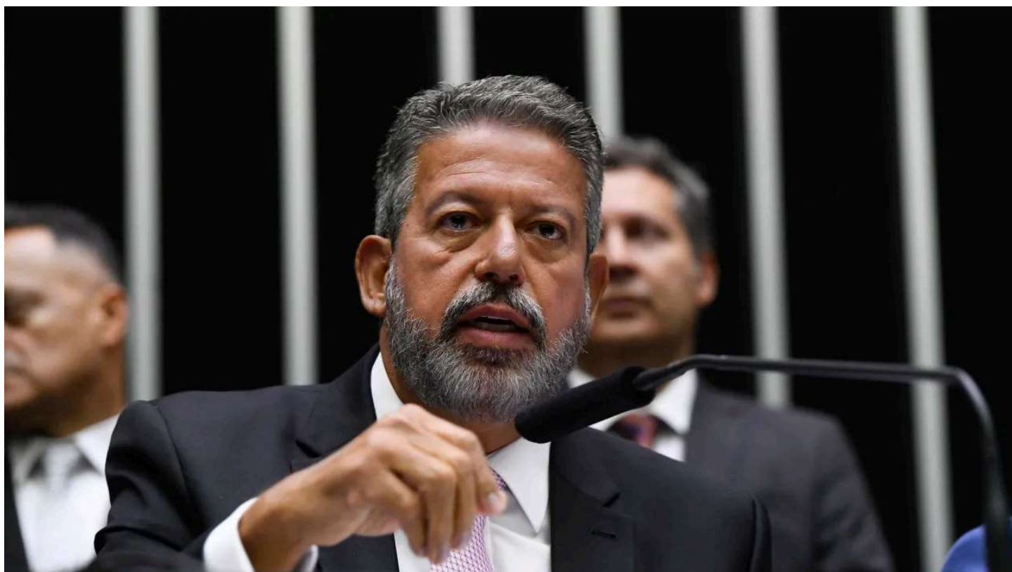
O presidente da Câmara, Arthur Lira