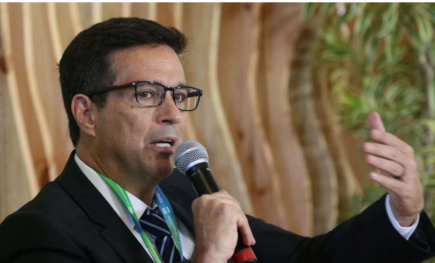
O presidente do Banco Central, Roberto Campos Neto

O Brasil começará o segundo semestre com boas e más notícias. Os juros vão baixar, a bolsa está subindo, o desemprego está caindo e a economia dá sinais de vida. Porém, o clima na economia e na política continua instável. Apesar dos tropeços do governo, a situação é melhor do que a esperada. A crise que estava sendo contratada não veio, ainda que o desempenho no fim do ano não seja espetacular. Como explicar? De certa forma, os freios e contrapesos do Legislativo e do Judiciário trazem alguma tranquilidade a eventuais deslizes do Executivo. O semipresidencialismo e o pragmatismo de setores do governo