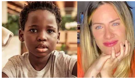
Péssima mãe? O real motivo para o filho de Ewbank volta à África HERBEAUTY