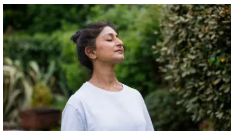
Herpes zoster: conheça 8 curiosidades sobre a doença