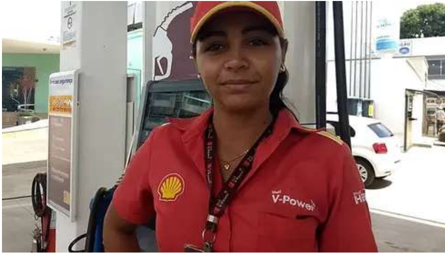
Ex-frentista larga emprego ganhando R$ 5 mil por dia fazendo isso OLYMP TRADE