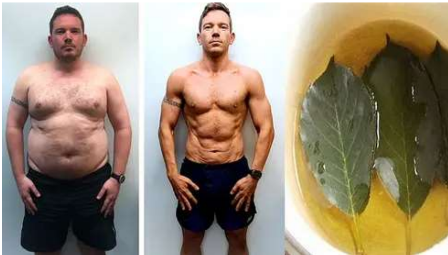
Basta 1 dose disto antes de dormir, para perder 17kg em 21 dias! SPIROTRILL