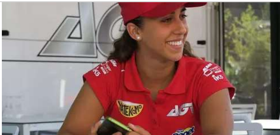
De frentista a multimilionária em 2 meses aplicando este truque OIL TRADE