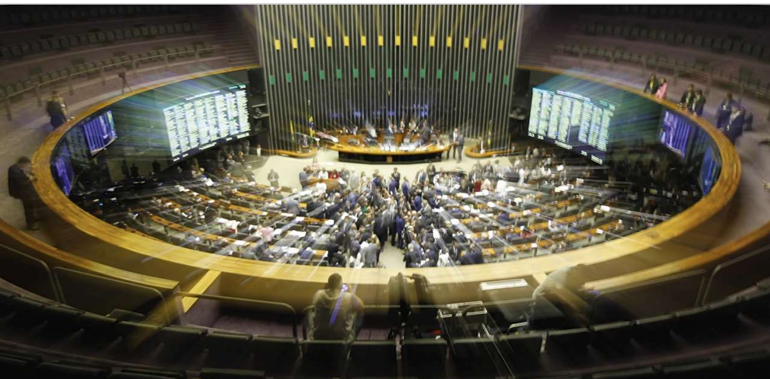
O Congresso Nacional - (Beto Barata/Agência Senado)

Em 2018, antes das eleições gerais, o Conselho de Comunicação Social do Congresso Nacional propôs um debate aprofundado sobre as fake news no país. Como presidente do organismo, solicitei à assessoria legislativa do Senado Federal uma minuta de projeto de lei sobre o tema. Após debate no conselho, a proposta seria encaminhada ao presidente do Congresso, o então senador Eunício Oliveira, para ser transformada em projeto de lei.