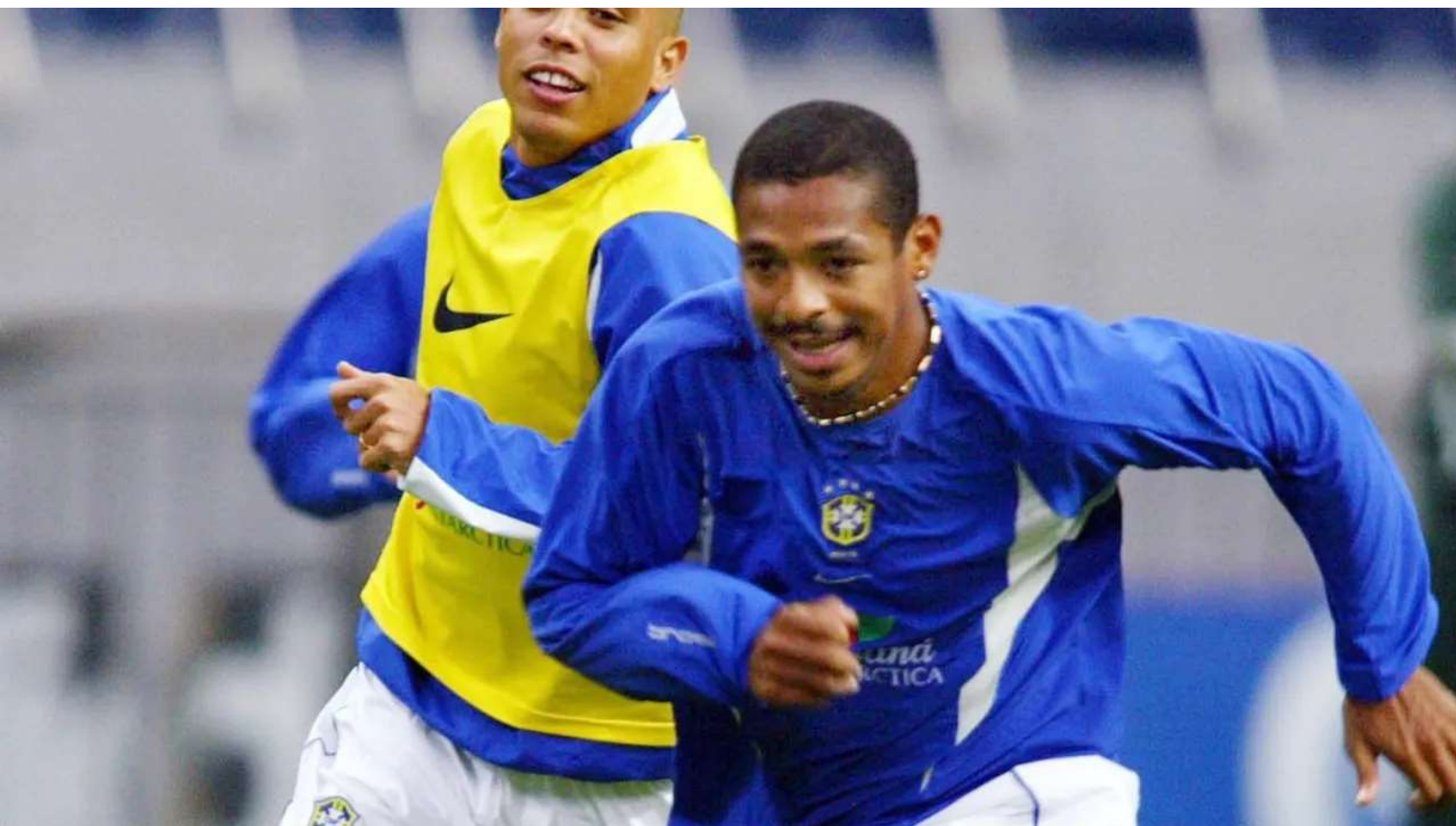
Vampeta: "Eles fingem que pagam, eu finjo que jogo"

Quando estava no Flamengo, o futebolista multicampeão Vampeta disse uma frase lapidar em relação ao time que se aplica à política: "Eles fingem que pagam, eu finjo que jogo". A minirreforma ministerial pode estar no mesmo padrão de ambiguidade — eu finjo que abro espaço relevante no ministério e você finje que me apoia