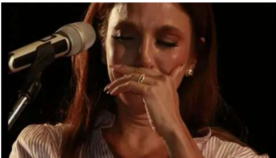
Escondeu muito bem! A controversa vida amorosa de Ivete Sangalo HERBEAUTY