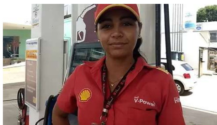
Ex-frentista larga emprego ganhando R$ 5 mil por dia fazendo isso