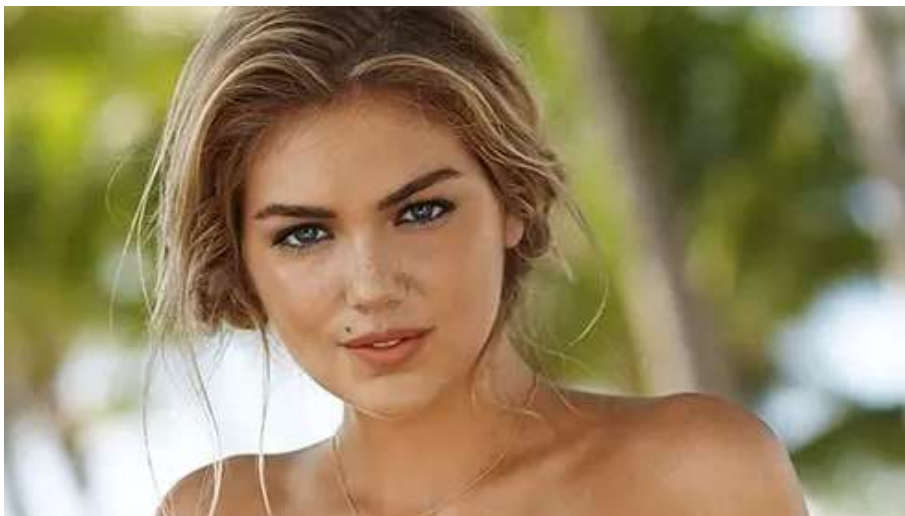
As 8 modelos plus size mais lindas do mundo