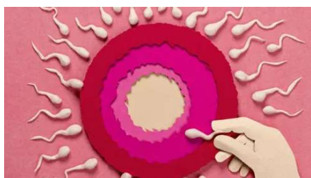
Câncer de mama e fertilidade: 8 perguntas e respostas