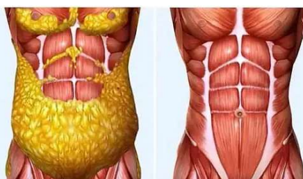
Um truque simples para queima 1kg de gordura da barriga por dia