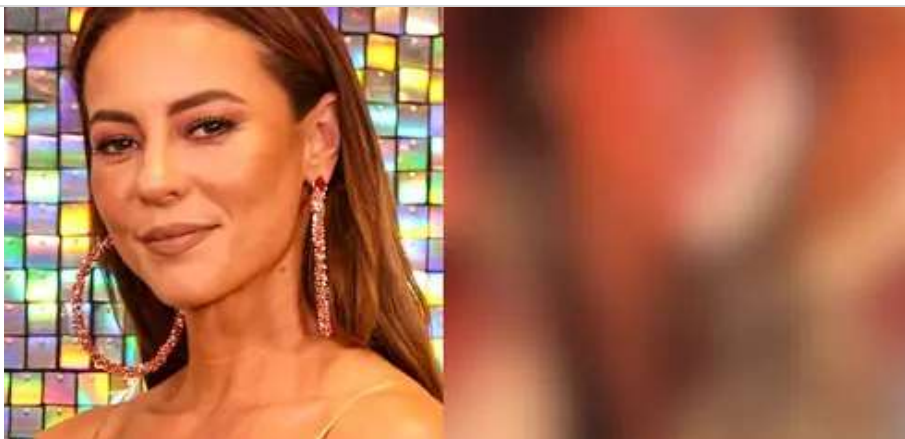
Paolla Oliveira exhibe-se ao natural e deixa fãs babando