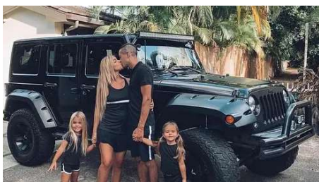
Família desempregada vive vida de luxo após este truque