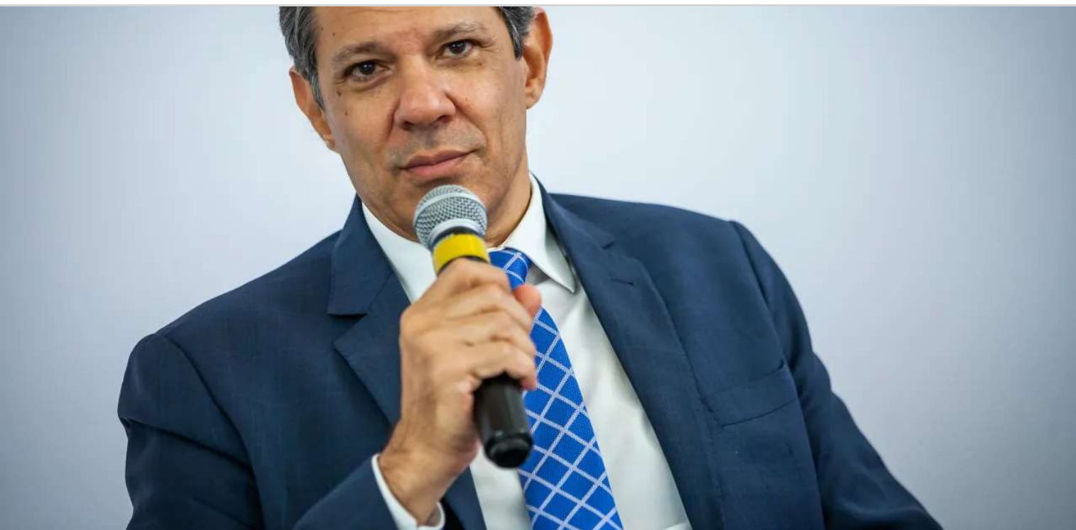
O ministro da Fazenda, Fernando Haddad

Um dos desafios mais sérios que o governo enfrenta é construir credibilidade perante os agentes econômicos. Sem ela, investimentos são postergados e a dinâmica da economia perde energia. O início do governo Lula trouxe muitas dúvidas. Além das declarações polêmicas sobre juros e o mercado, havia questões sobre a composição da equipe, como ela se relacionaria com o Banco Central independente e, ainda, como lidaria com as pressões do mercado e com o fogo amigo do governo.