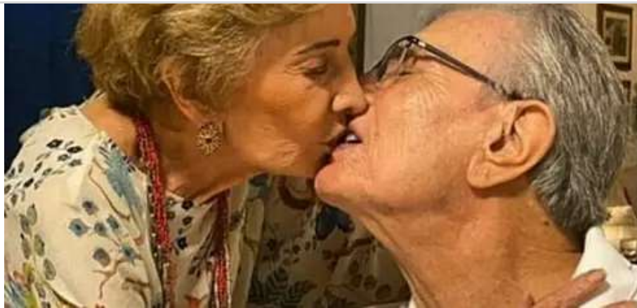
Drama na família Meira: revelações pós-morte de ator vêm à tona HERBEAUTY