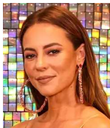
Paolla Oliveira exhibe-se ao natural e deixa fãs babando HERBEAUTY