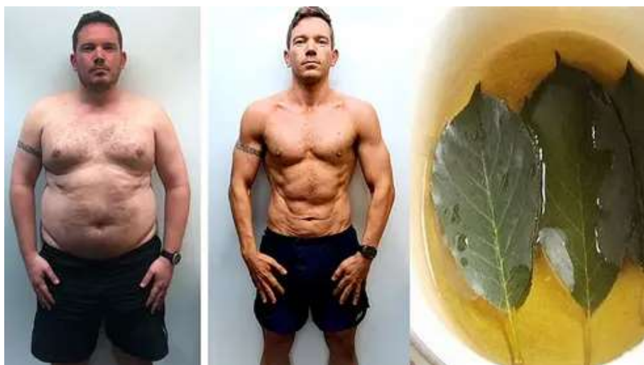
Basta 1 dose disto antes de dormir, para perder 17kg em 21 dias! SPIROTRILL