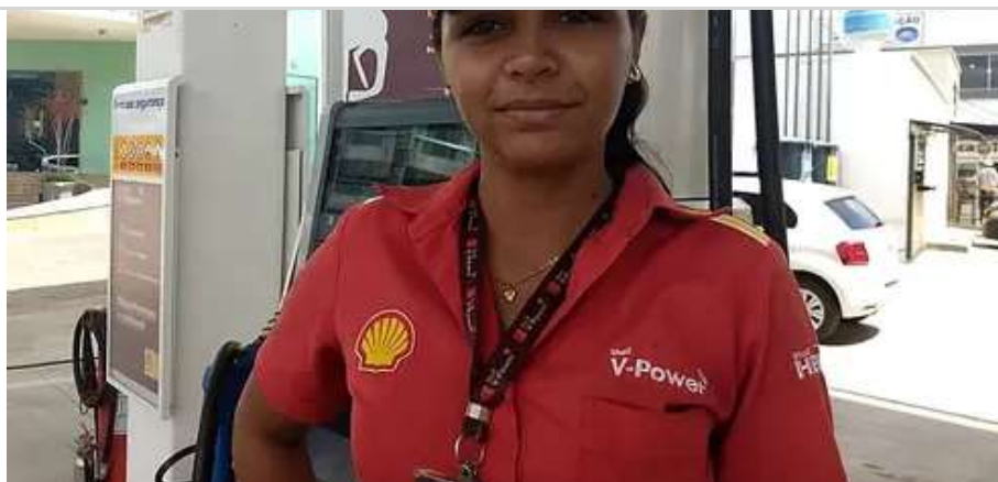
Ex-frentista larga emprego ganhando R$ 5 mil por dia fazendo isso OLYMP TRADE