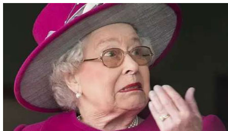
Fato obscuro sobre a Rainha vaza na mídia e choca família real HERBEAUTY