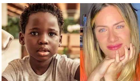
Péssima mãe? O real motivo para o filho de Ewbank volta à África HERBEAUTY