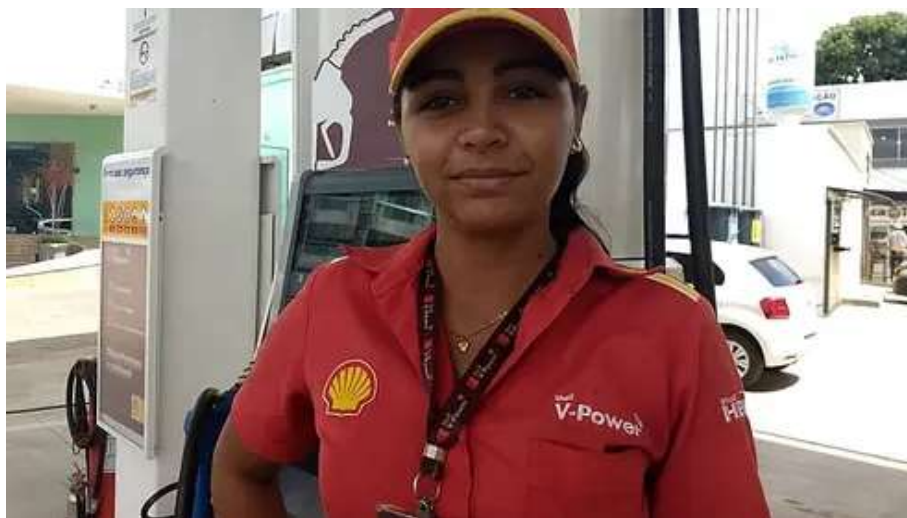
Ex-frentista larga emprego ganhando R$ 5 mil por dia fazendo isso OLYMP TRADE