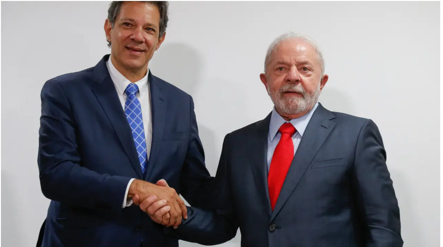
Haddad e Lula

Desde as eleições de outubro, o novo governo emite sinais e ruídos contraditórios. Tal fato se comprova pela assertividade e abundância de declarações polêmicas. Em vez de prevalecer o equilíbrio e a prudência, as vibrações eleitorais seguem predominando.