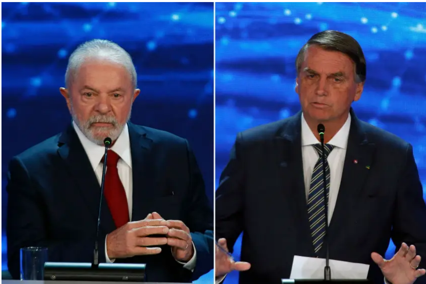
Lula e Jair Bolsonaro

Chegamos à reta final da campanha para o primeiro turno das eleições presidenciais. Nunca antes neste país, para repetir o bordão de um dos candidatos, tantas dúvidas pairaram sobre o processo eleitoral. São tantas que, para enfrentá-las, seria necessário um espaço muito maior do que o desta coluna. Mas, com o desafio posto, vou tentar fazer um painel das dúvidas que assolam o processo. Responder a elas já é outro desafio que me reservo para ocasiões futuras.