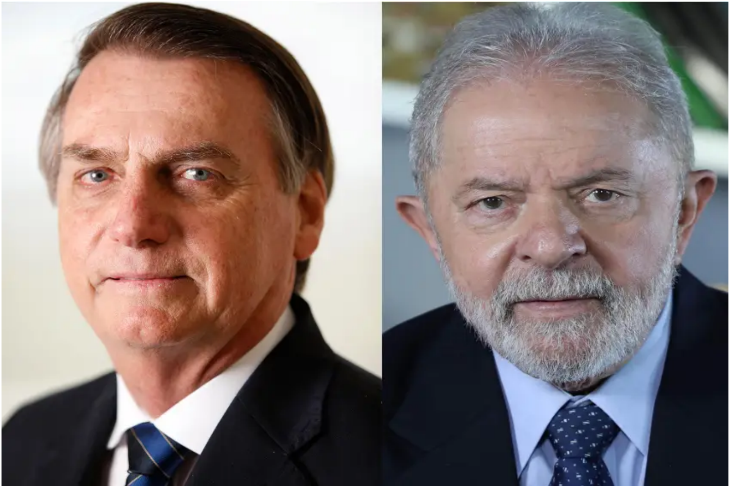
Bolsonaro e Lula

Agosto é um mês marcado por acontecimentos políticos importantes e dramáticos no Brasil. Figuras exponenciais morreram no mês, caso de Getúlio Vargas, Juscelino Kubitschek, Eduardo Campos. Dilma Rousseff foi definitivamente afastada do Palácio do Planalto em agosto, mês em que Jânio Quadros renunciou à Presidência e o presidente Costa e Silva sofreu um AVC. É lugar-comum dizer que agosto é o mês do cachorro louco, bem como alertar para a possibilidade de ocorrência, nessa época, de fatos impactantes na política. Sem pensar em coincidências e sem olhar muito para episódios do passado, pode-se dizer que este agosto também promete ventanias fortes.