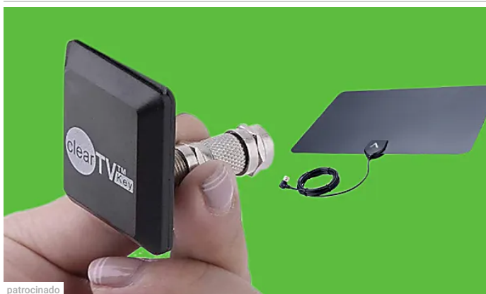
patrocinado OctaAir: Canais Exclusivos em HD