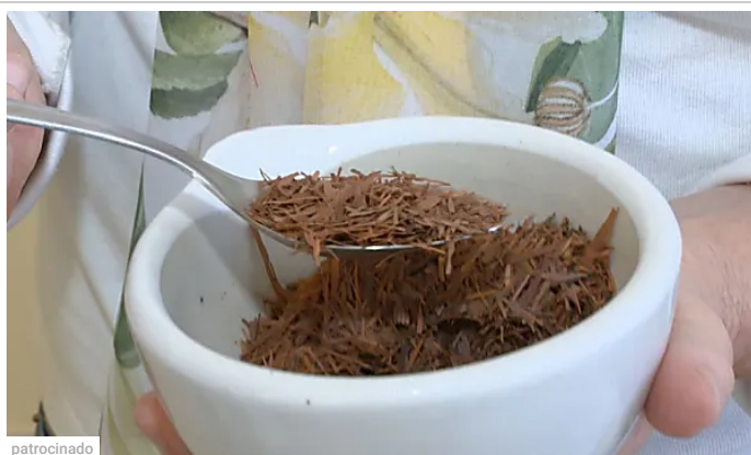
patrocinado Portal do Diabético