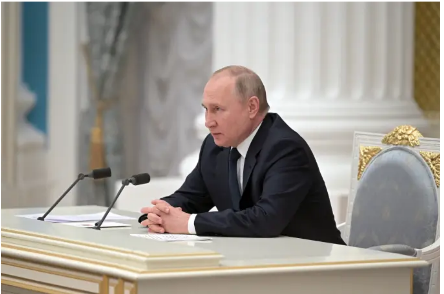
Vladimir Putin

Ao invadir a Ucrânia, Vladimir Putin provocou a privatização da guerra. Tal fenômeno é novo na escala em que ocorre. Com a agressão à Ucrânia, o presidente da Rússia mobilizou contra si, e contra a Rússia, as forças privadas do mundo. Nem na II Guerra se viu algo parecido, fosse por causa das limitações da globalização na época, fosse pela incapacidade de o setor privado se mobilizar.