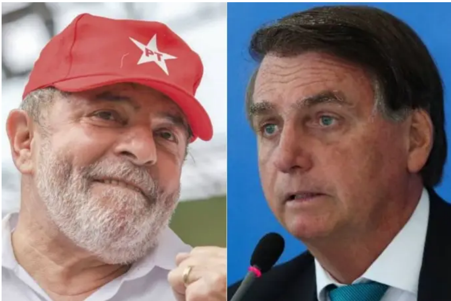
O ex-presidente Lula (e) e o presidente Jair Bolsonaro

O ano mal começou e o bestialógico na política já se faz presente. Duas recentes declarações expressas pelos dois ponteiros da campanha eleitoral à