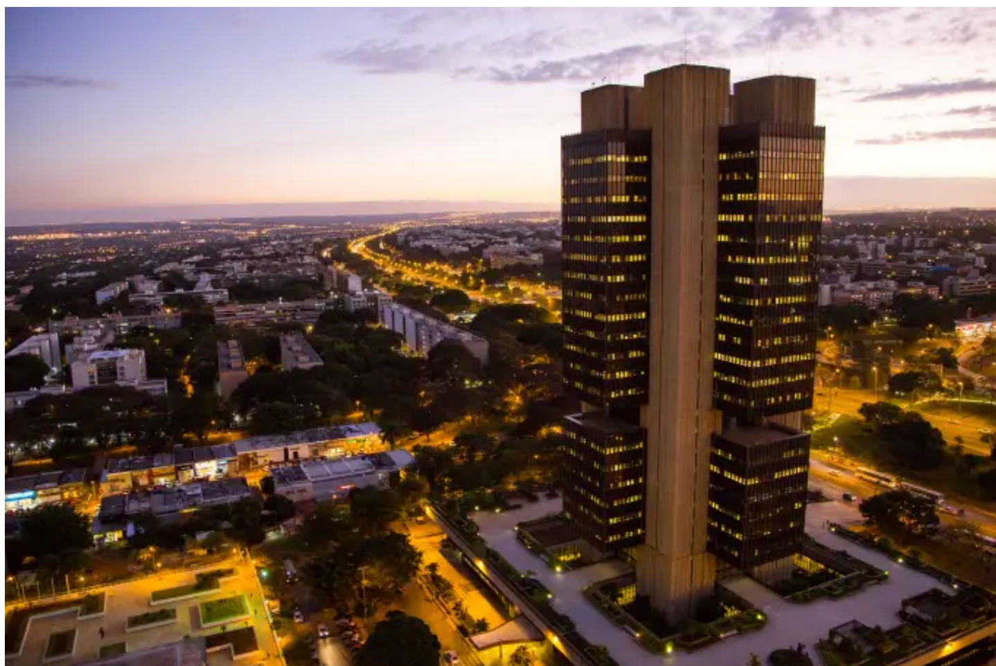
Edifício Sede do Banco Central em Brasília

Nesta semana, o Supremo Tribunal Federal (STF) volta a examinar a questão da autonomia do Banco Central. Trata-se de um debate do século XX no