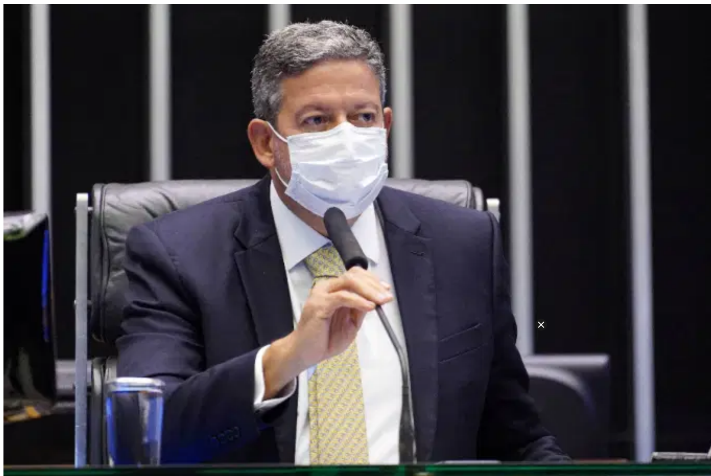
O presidente da Câmara dos Deputados, Arthur Lira (PP-AL), defende que a reforma seja feita por partes

A reforma tributária deverá ganhar novo impulso no Congresso, já que está prevista para os próximos dias a apresentação do projeto. Será esse o primeiro passo para dar esse movimento? Podemos ter sérias expectativas?