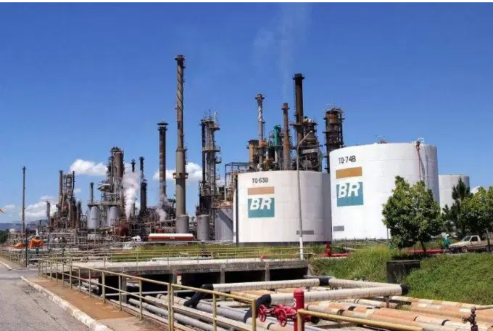
Refinaria Landulpho Alves (Rlam), da Petrobras

Em janeiro, quando a Petrobras resolveu aumentar o preço do diesel às portas de uma potencial greve de caminhoneiros, sua direção deu uma demonstração de insensibilidade e incompetência.