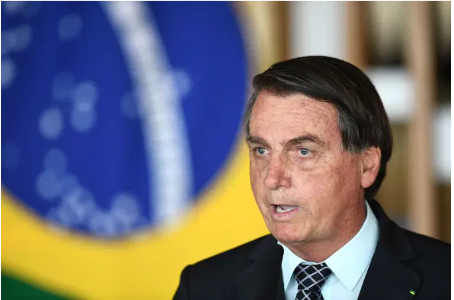
Para o presidente Jair Bolsonaro, as pautas que interessam são as que contribuem para a construção do caminho que leve à reeleição

O impeachment da ex-presidente Dilma Rousseff destravou as condições para que o Brasil pudesse entrar em um dos mais virtuosos ciclos de reformas da história da nossa economia. Na contramão da tradição e do senso comum — que não