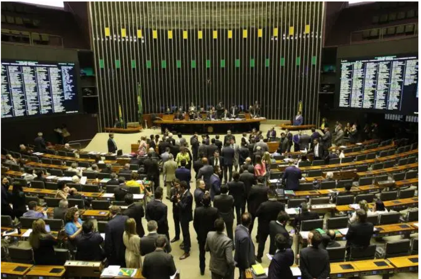
Plenário da Câmara dos Deputados

Com a quase impossibilidade de aprovação de emenda constitucional permitindo a reeleição de presidentes das casas do Congresso na mesma legislatura, abriu-se a temporada de pré-candidaturas aos postos.