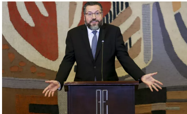
O chanceler Ernesto Araújo ao tomar posse

A Coalizão Empresarial, entidade que representa 39% do PIB industrial do Brasil, a Fiesp e entidades do agronegócio fizeram chegar ao governo a informação de que o nome ideal para a embaixada do Brasil em Washington é o de Murillo de Aragão.