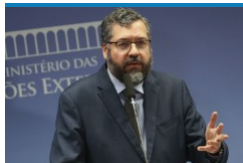
Ernesto Araújo, ministro das Relações Exteriores

O comunicado foi publicado no Diário Oficial da União (DOU). A remoção era esperada, já que o presidente Jair Bolsonaro havia afirmado que iria trocar ainda neste semestre o chefe da embaixada brasileira em Washington.