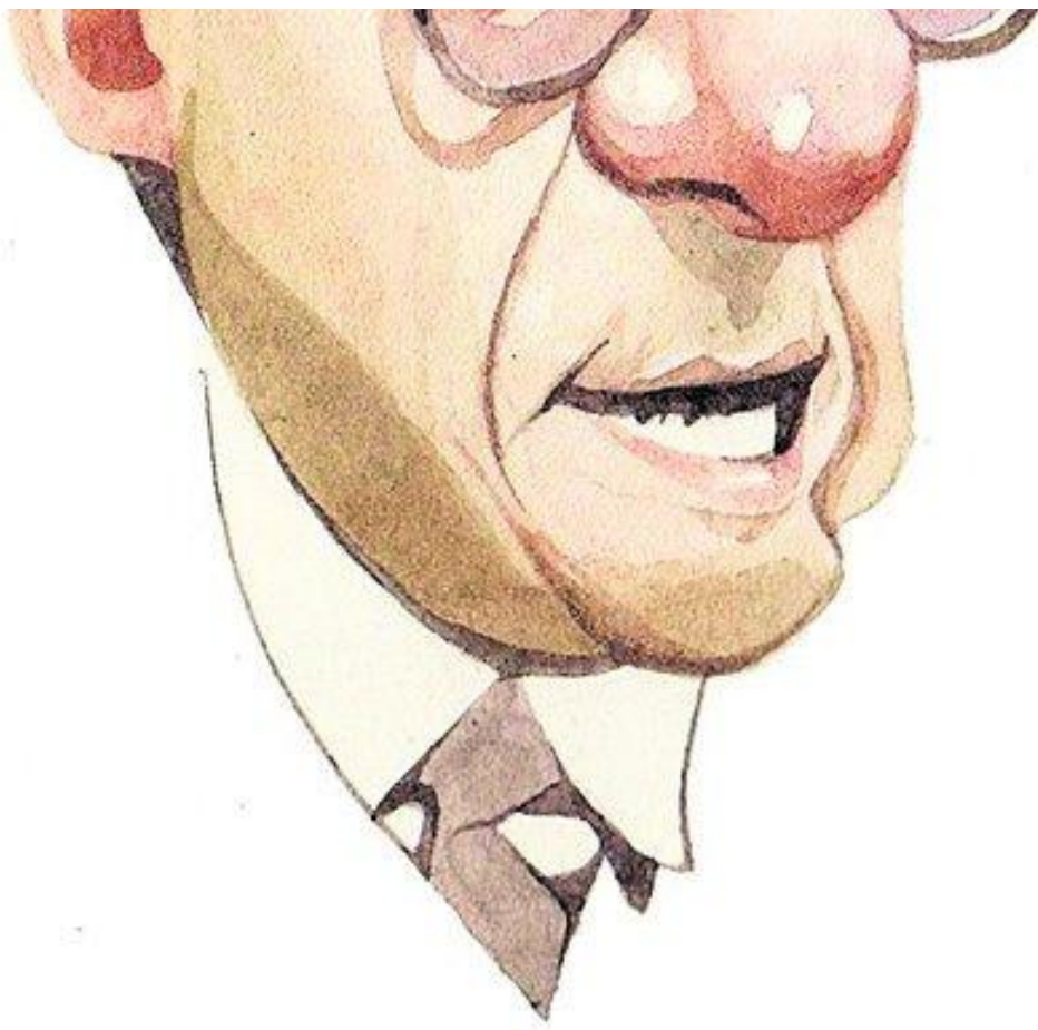
ILUSTRAÇÃO: KLEBER SALES/ESTADÃO

Acima. Levantamento do Tribunal de Contas da União mostra que em 104 empresas estatais 200.578 funcionários (92,85% do total) recebem acima da mediana do que é pago no mercado e 55,66% recebem duas medianas de mercado.