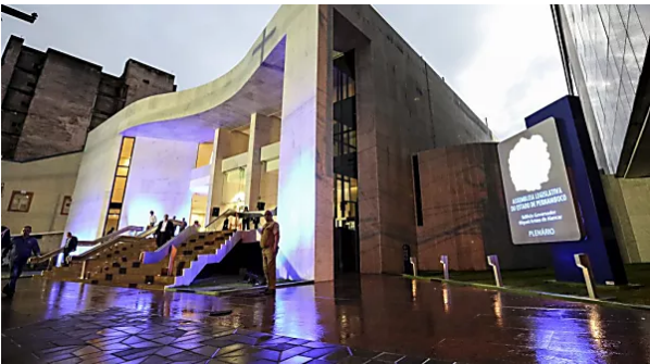
Confira os deputados estaduais eleitos em Pernambuco

TAGS: 2º turno chegar pode novo fator barbosa joaquim supremo do ex-presidente