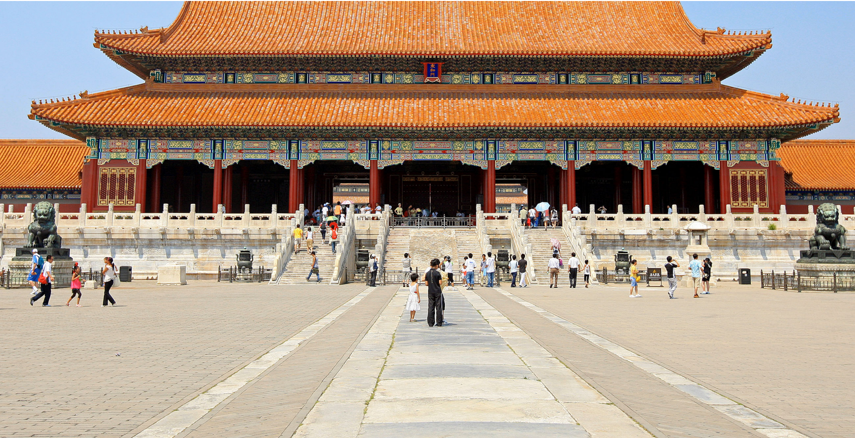
PRACA DA PAZ CELESTIAL, EM PEQUIM.

Do quadro montado pela Embaixada do Brasil em Pequim sobre o orçamento chinês de 2018 – recentemente aprovado –, chamam a atenção dois itens atrelados diretamente ao processo de crescimento econômico. A prioridade para Ciência e Tecnologia, terceiro gasto mais importante da lista, e a irrelevância com que é tratada a Seguridade Social.