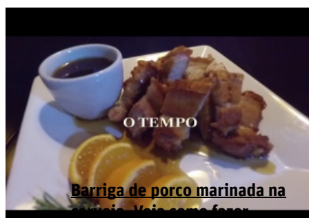
Barriga de porco marinada na cerveja. Veja como fazer

(/tv/barriga-de-porco-marinada-na-cerveja-veja- como-fazer-1.1472812)