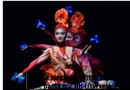
a magia do circo da China

(/tv/conhe%C3%A7a-os-%C3%ADndios-kaxix%C3%B3-1.1470133)