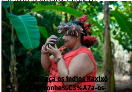
Conheça os índios Kaxixó

(/tv/veja-a-nossa-homenagem-%C3%A0-44%C2%AA-conquista-do-galo-1.1470753)