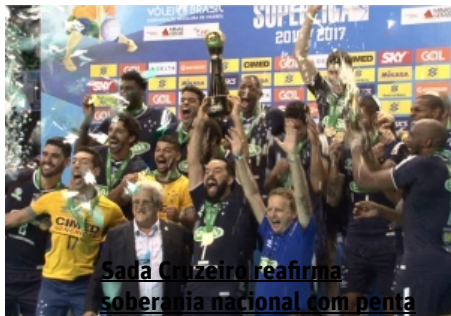
Sada Cruzeiro reafirma soberania nacional com penta

(/tv/sada-cruzeiro-reafirma-soberania-nacional-com-penta-da-superliga-1.1470454)