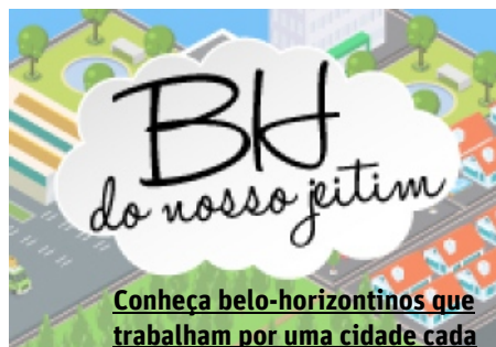
Conheça belo-horizontinos que trabalham por uma cidade cada

(/tv/bebeto-de-freitas-secret%C3%A1rio-municipal-de-esporte-e-lazer-1.1423787)