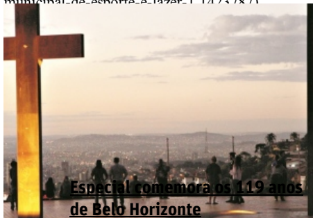
Especial comemora os 119 anos de Belo Horizonte

(http://www.otempo.com.br/hotsites/bh-do-nosso-jeitim)