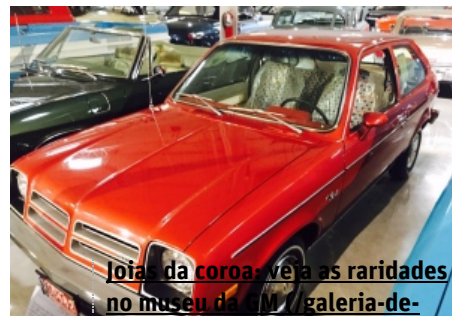
Joia da coroa: veja as raridades no museu da GM / galeria-de-

Vídeos (/tv) | Fotos (/galeria-de-fotos) | Infográficos (/infograficos) | Especiais (/especiais)