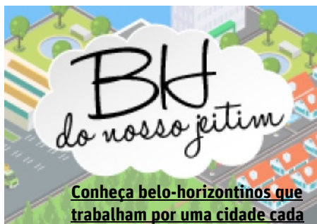
Conheça belo-horizontinos que trabalham por uma cidade cada

(/tv/bebeto-de-freitas-secret%C3%A1rio-municipal-de-esporte-e-lazer-1.1423787)