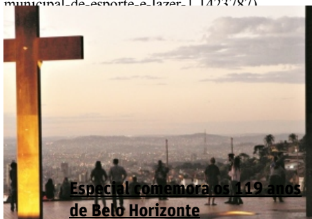
Especial comemora os 119 anos de Belo Horizonte

(/http://www.otempo.com.br/hotsites/bh-do-nosso-jeitim)