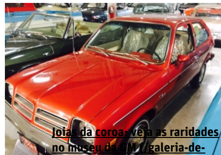
Joias da coroa-veja as raridades no museu da GM

(/tv/grupa-mostra-que-n%C3%A3o-h%C3%A1-mais-esp%C3%A7o-para-preconceito-no-futebol-1.1404615)